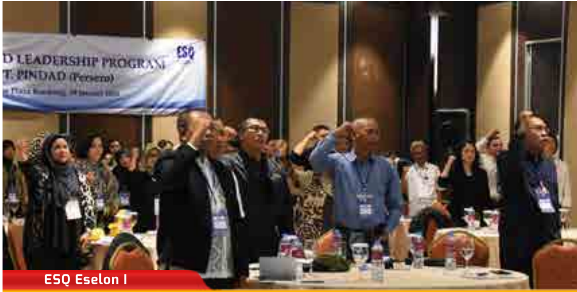
ESQ Eselon I

Values Based Leadership Program PT. Pindad (Persero) yang diikuti oleh para direksi dan pejabat strata satu di Hotel Crowne Plaza, Bandung (19/1). Kegiatan ini mendatangkan seorang narasumber yang merupakan trainer handal pendiri ESQ Leadership Center, Ary Ginanjar Agustian.