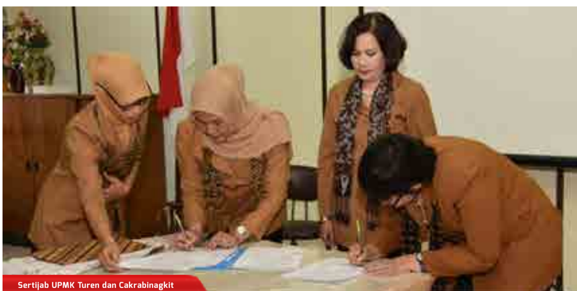
Sertijab UPMK Turen dan Cakrabingkit

PT Pindad (Persero) berupaya meningkatkan sistem dan manajemen mutu dan lingkungan dengan melakukan upgrading sertifikat International Organization for Standardization (ISO) 9001:2008 menjadi ISO 9001:2015 serta ISO 14001:2004 menjadi ISO 14001:2015 dengan menggelar training awereness di Auditorium Pindad, Bandung (15/01)