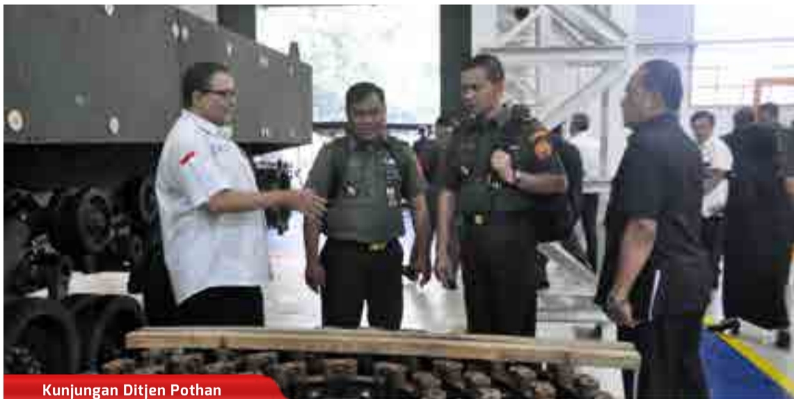
Kunjungan Ditjen Pothan

Perayaan natal gabungan PT. Pindad (Perseo), PT INTI (Persero) dan PT LEN (Persero) di Hotel Crowne, Bandung. Perayaan di hadiri oleh Direktur Utama Pindad, pejabat PT Inti dan PT Len serta para karyawan dari tiga perusahaan. (28/1)