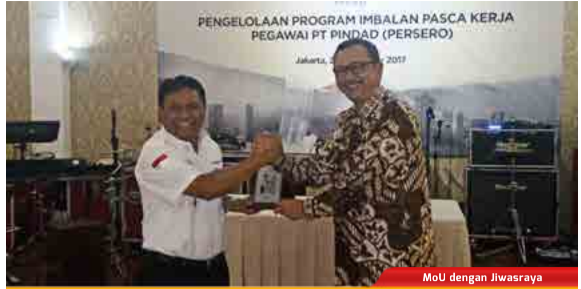
MoU dengan Jiwassraya

Values Based Leadership Program PT. Pindad (Persero) yang diikuti oleh para direksi dan pejabat strata satu di Hotel Crowne Plaza, Bandung (19/1). Kegiatan ini mendatangkan seorang narasumber yang merupakan trainer handal pendiri ESQ Leadership Center, Ary Ginanjar Agustian.